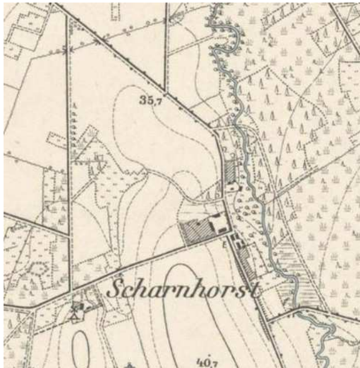
Um 1980 mit Standrt der Windmühle

„Schernhorst“ ( Casimir/Ohainski, Territorium, S. 67 )