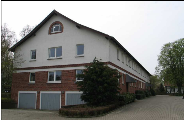
Das Institut im Jahre 2010

wurde in Scharnhorst das Bundessortenamt mit einer Prüfstelle eingerichtet. Sie gehörte bis zum Max-Planck-Institut für Züchtungsforschung (MPIZ), seither Max-Planck-Institut für Pflanzenzüchtungsforschung (MPIPZ) 4 .