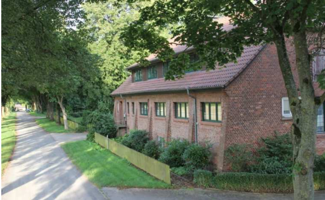
Typisches Remontengebäude, als Wohnhaus umgebaut

Schon seit dem Jahre 1894 waren in den Sommermonaten vorübergehend Militärpferde (Remonten 3 ) in Scharnhorst eingestellt worden. Etwa 70 bis 80 Pferden wurden erst nach der Einrichtung der früheren Schafstallscheune zu Remonteställen 1902 dauerhaft untergebracht. Nach einem Vertrag vom 17.2.1894 wurde für den Zeitraum 1.5. 1896- 1916 die Klosterdomäne Mariensee dazu gepachtet. Scharnhorst war nun Königliches Remontedepotvorwerk.