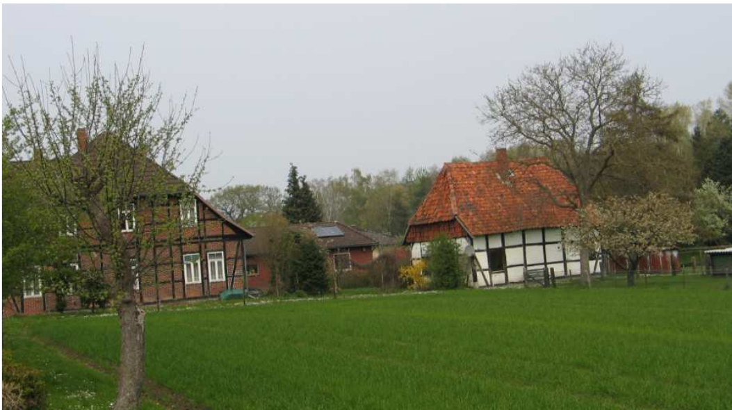
Ortslage Scharnhorst

Nähere Angaben über das Vorwerk Scharnhorst, das eine Gründung der Grafen von Wölpe sein soll, werden erst in der Amtsbeschreibung von 1755 erwähnt. Danach hatte die Landesherrschaft, das jetzt das Vorwerk gehörte, das Recht aus dem Meteler Tannenbruche das zu den Gebäuden nötige Bauholz zu entnehmen.