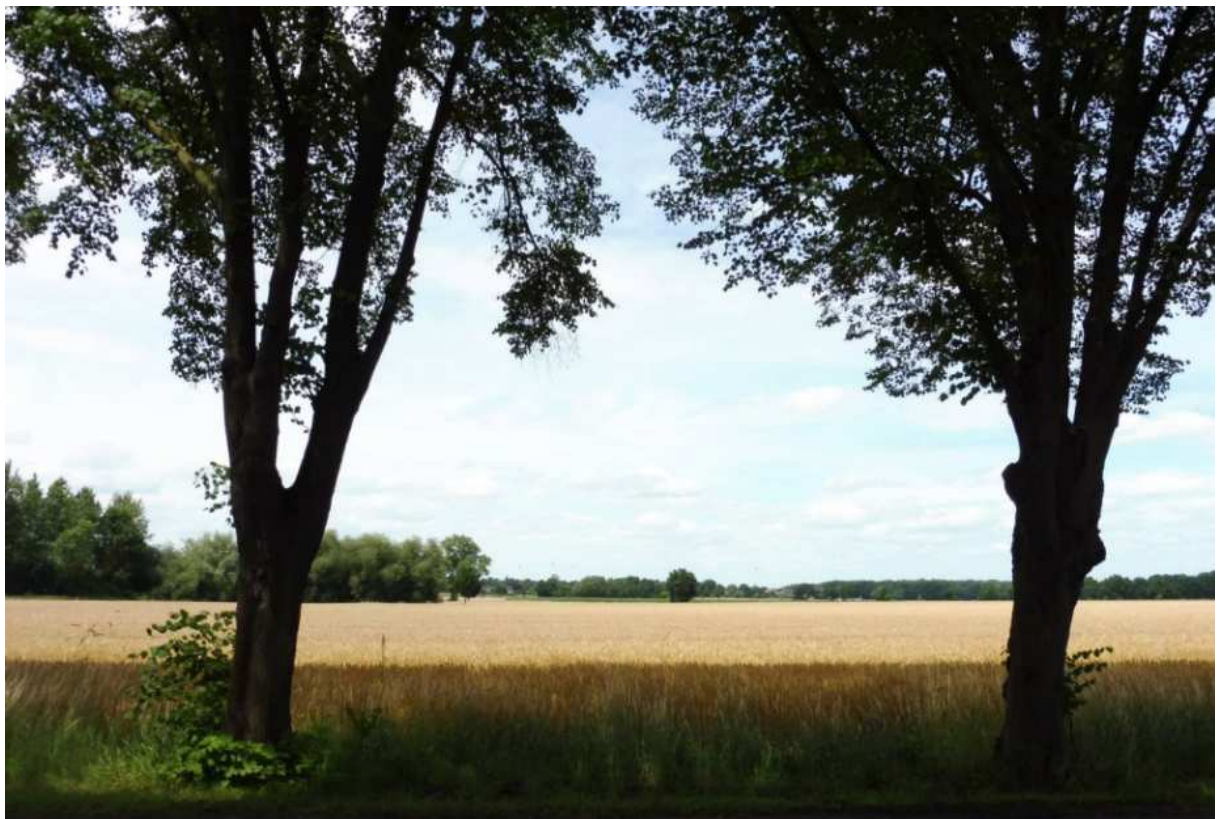
Scharnhorst: Viel Landschaft

Nach der deutschen Kapitulation hielt die britische Militärregierung hier Einzug. Am 6.4.1946 siedelte sich die ehemalige ostpreußische Reichsstelle des Kaiser- Wilhelm-Instituts, die vom Kurischen Haff vertrieben wurde, in Scharnhorst an. Nunmehr wurden landwirtschaftliche Pflanzenzuchtversuche hier vorgenommen.