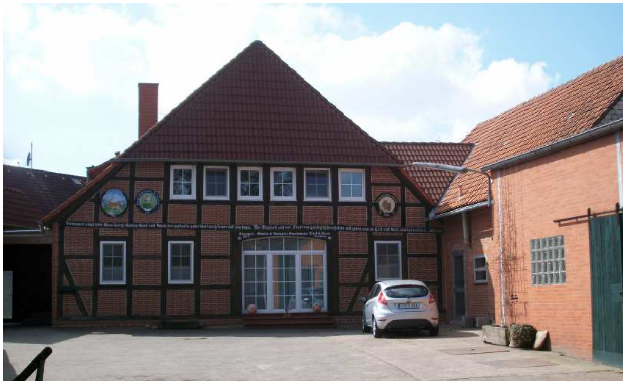
Helstorf Nr. 29