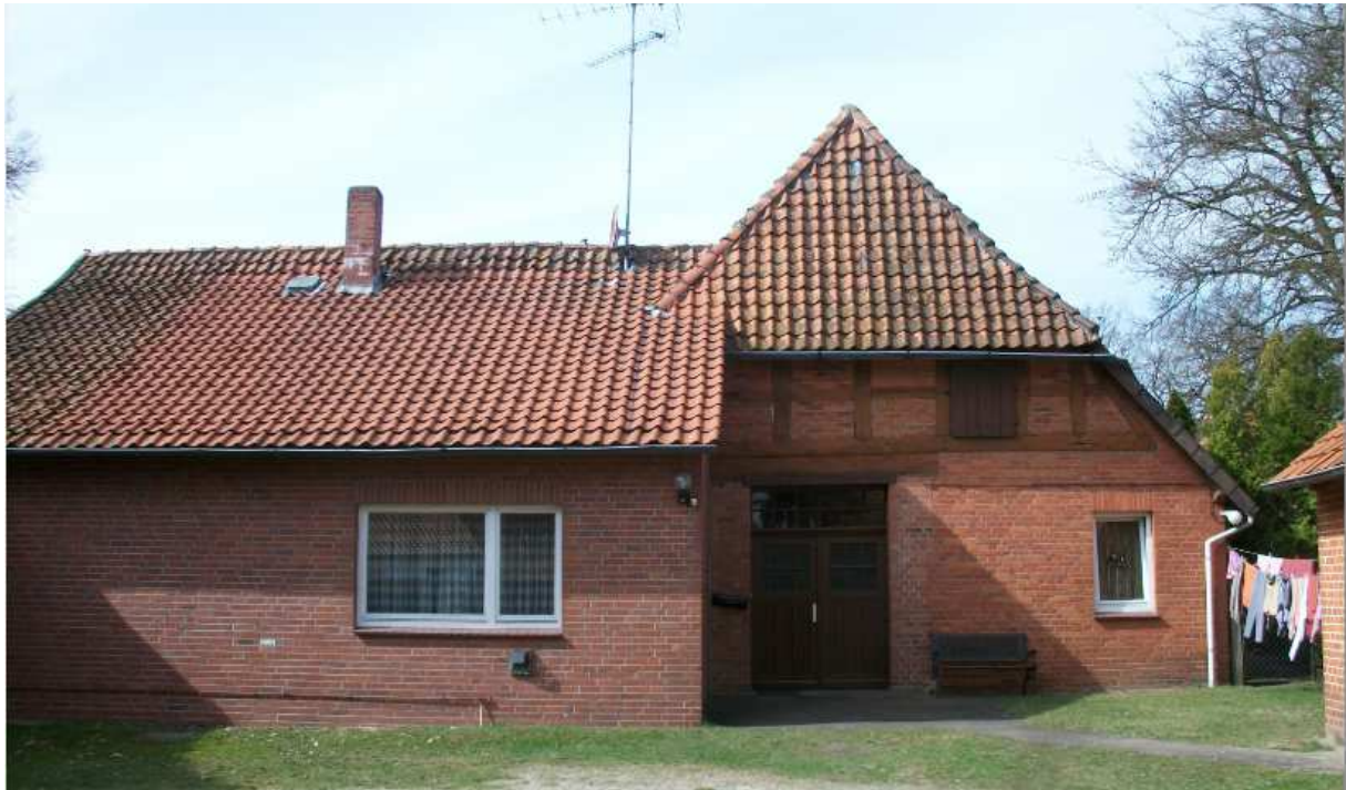
Die Stelle Helstorf Nr. 33