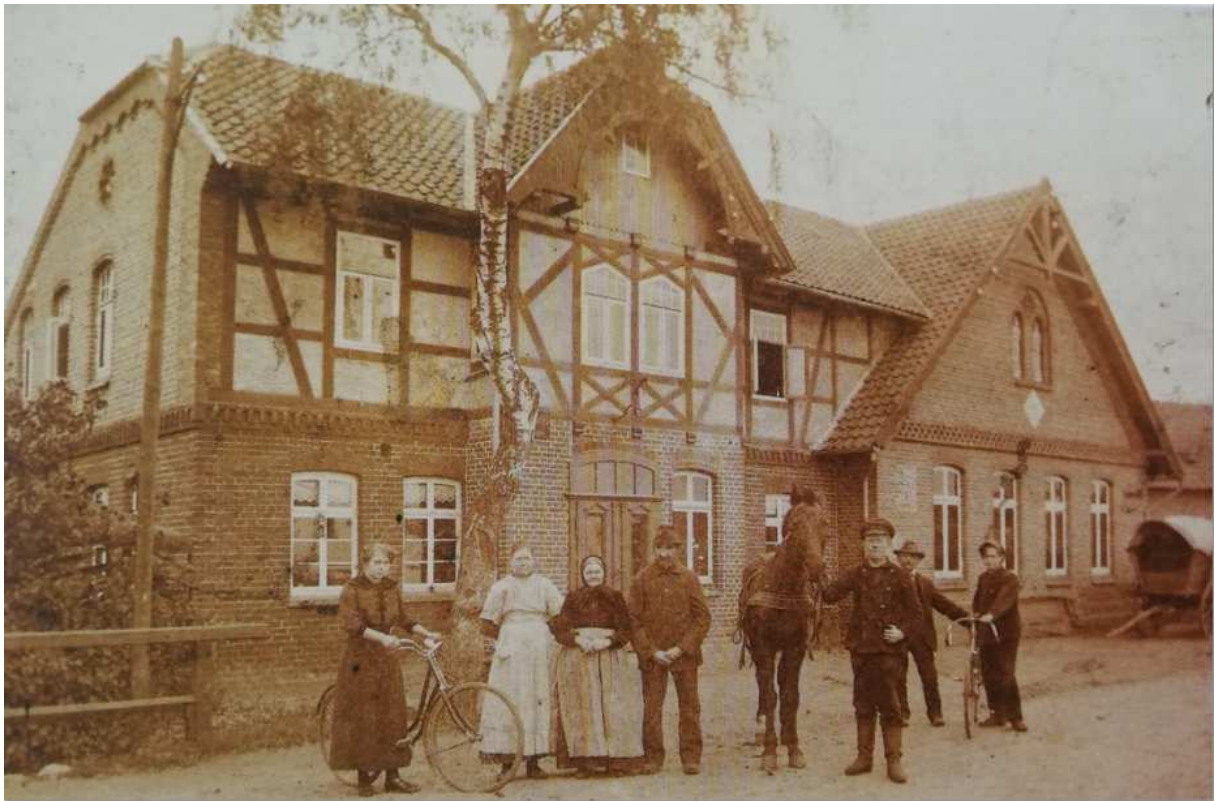
Gasthaus Müller um 1900

In Helstorf waren überwiegend Russen und Polen. Aus Angst vor den Kriegsgefangenen - auch hier Lehren aus dem Ersten Weltkrieg ziehend - wurden Hilfspolizisten zur Überwachung der Kriegsgefangenen eingesetzt, die in der Landwirtschaft arbeiten mussten.