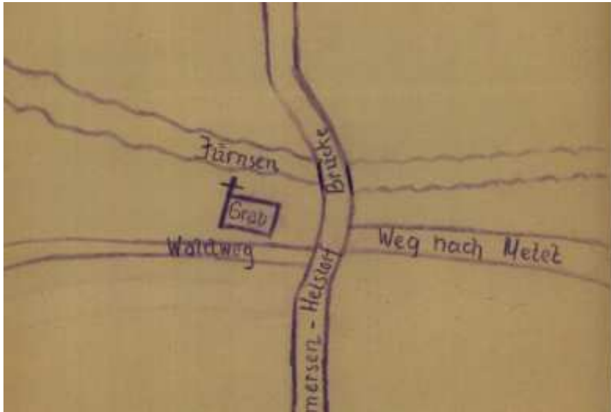
Plan des Grabes an der Jürse

Es hatte im Bereich des Doktorweges noch „lange nach dem 2. Weltkrieg“ ein „Russengrab“, also das Grab eines „russischen Soldaten“ gegeben. Wer dort lag und wann die Person umgebettet wurde, ist nicht bekannt 7 .