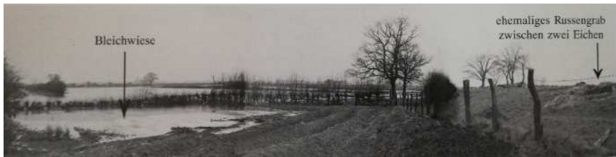
Ehemaliges Russengrab, Foto vom Hochwasser 1955

Die genaue Zahl der Zwangsarbeiter und Kriegsgefangenen, die in Helstorf starben und begraben wurden, lässt sich nicht mehr feststellen (s. auch weiter unten).