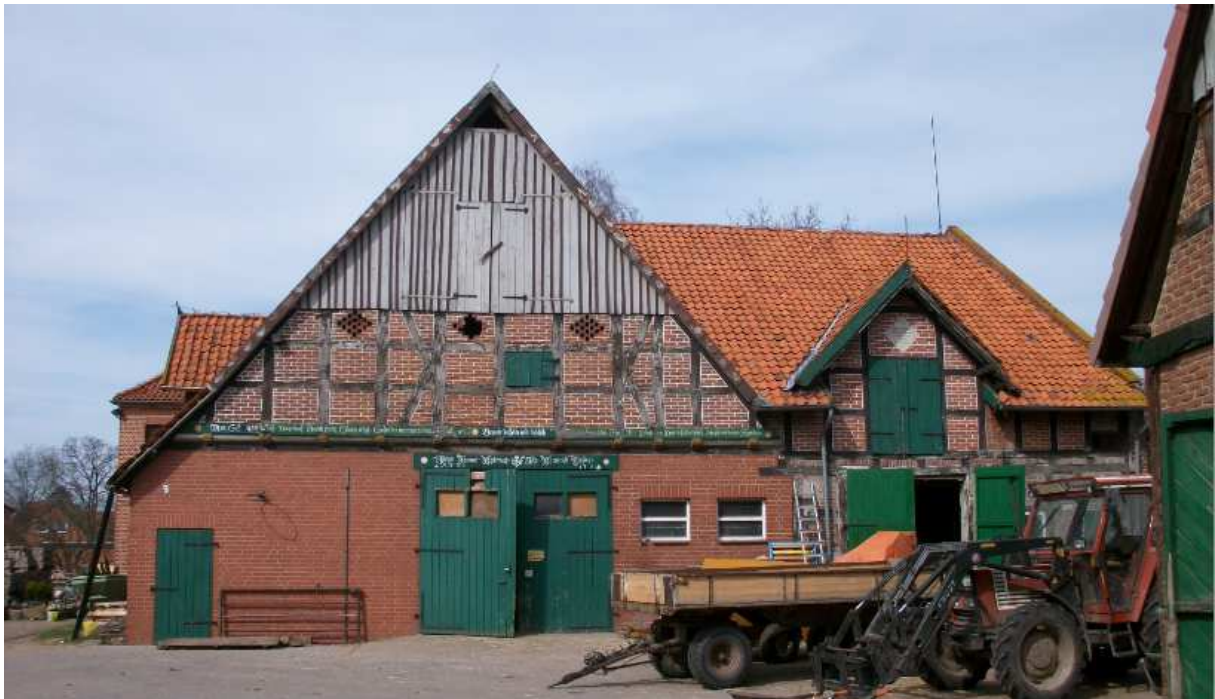
Der Hof Helstorf Nr. 3